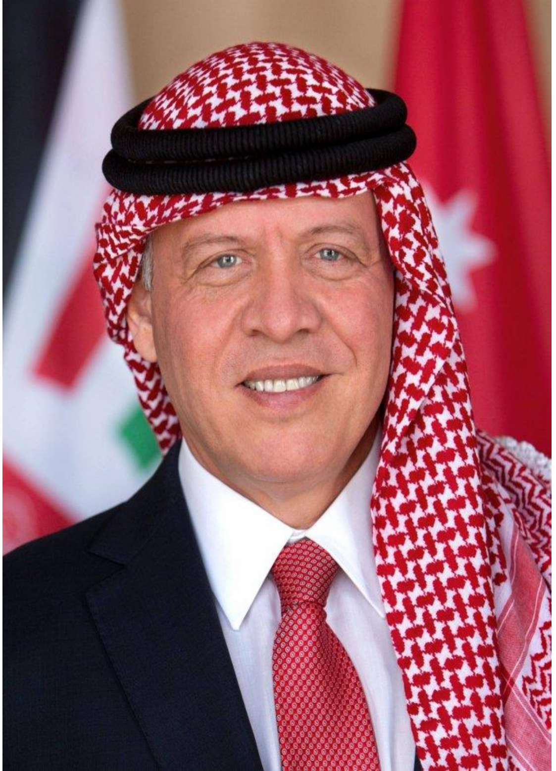
حضرة صاحب الجلالة الهاشمية الملك عبد الله الثاني ابن الحسين المعظم