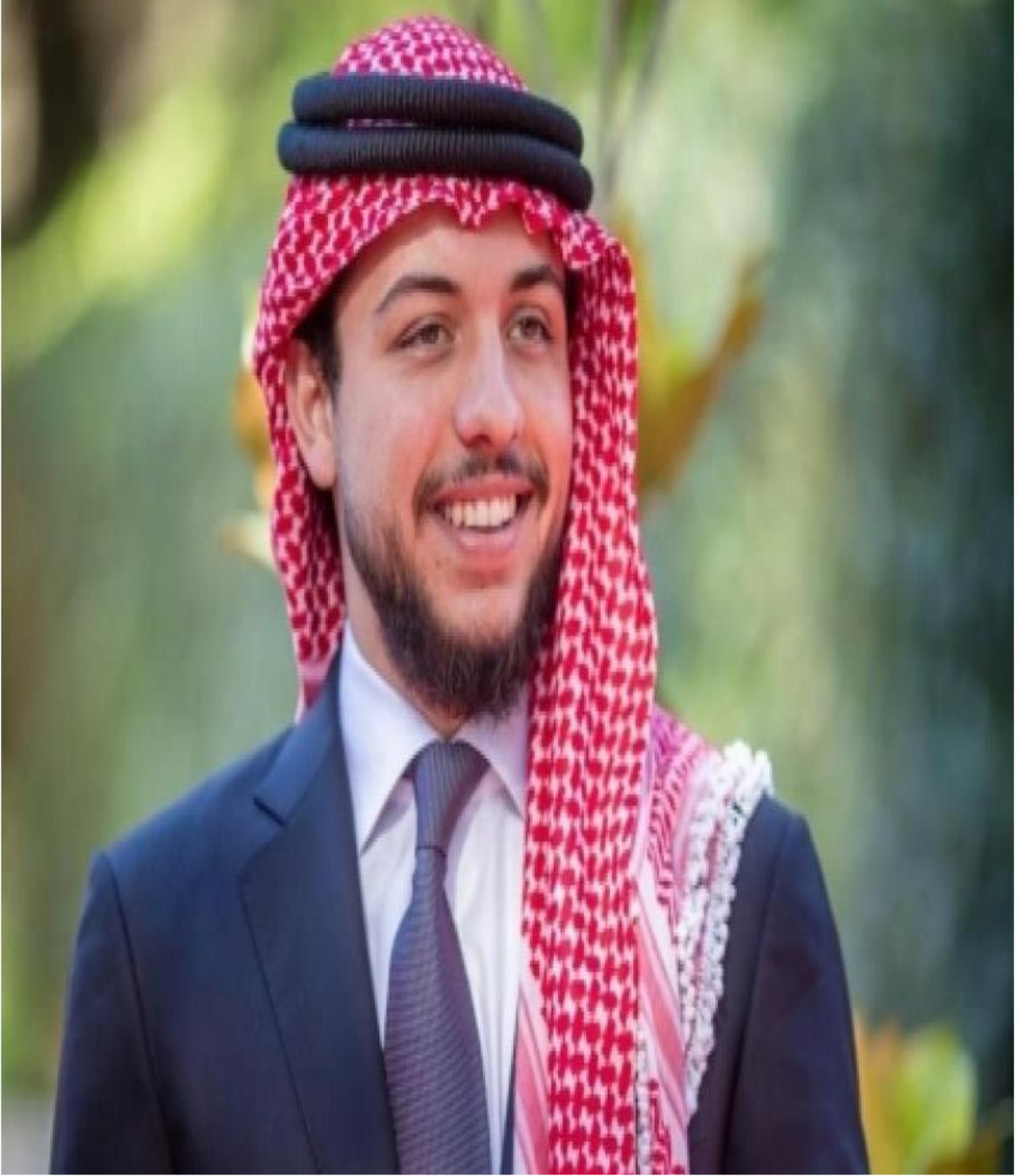
حضرة صاحب السمو الملكي الأمير الحسين بن عبد الله الثاني ولي العهد حفظة الله ورعاہ